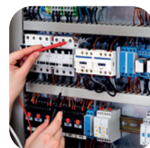
Сборка щитового оборудования